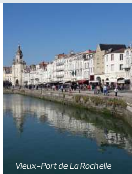
Vieux-Port de La Rochelle