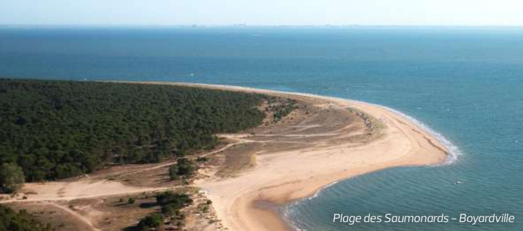
Plage des Saumonards – Boyardville