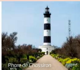
Phare de Chassiron