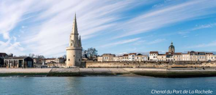
Chenal du Port de La Rochelle