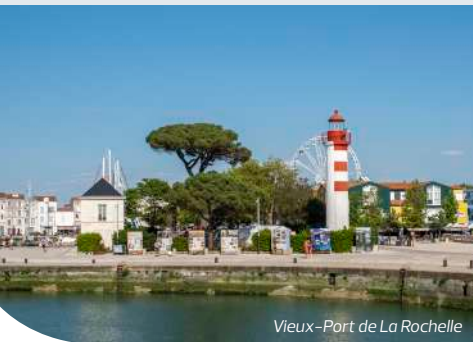
Vieux-Port de La Rochelle

La Rochelle, mille ans d'histoire d'une cité maritime à découvrir et à parcourir. Un héritage culturel et architectural riche : maisons médiévales, rues à arcades et hôtels d'armateurs racontent les grandes heures de La Rochelle.