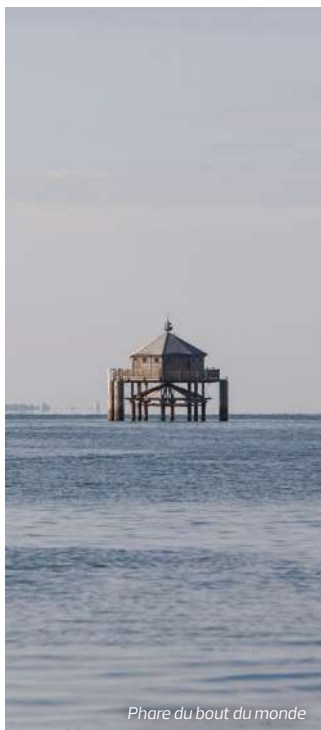
Phare du bout du monde